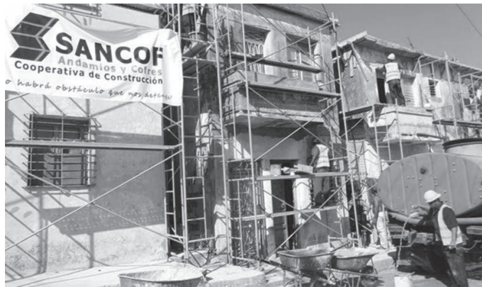
Nichtlandwirtschaftliche Genossenschaft „Bauwesen und Gerüstbau“ (Sancof)

Die Patenschaft war nicht auf das Dorf beschränkt, da es schwer zu erreichende Höfe mit körperlich behinderten Menschen gibt,