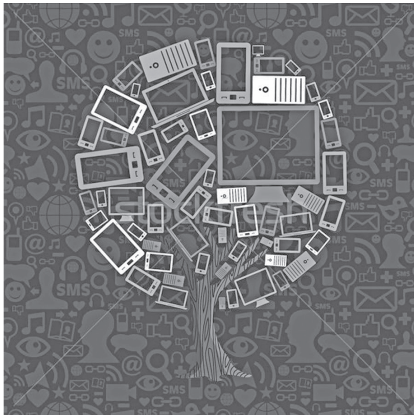
ILUSTRATION AUS PINTEREST

Darüber hinaus wird die technologische Entwicklung und die Konvergenz gewährleistet und dem Aufbau von Breitbandnetzen Vorrang eingeräumt. Die Verordnung schützt gleichzeitig die Interessen der