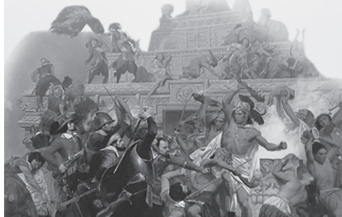
Das Bild stellt das Massaker von Tōxcatl dar, das auch als Massaker des Templo Mayor bekannt ist.

Oder träumen beide von einer tödlichen „befreienden Invasion“ für unser Land, wie diejenige, die vor 500 Jahren die Einwohner von Tenochtitlán massakrierte?*