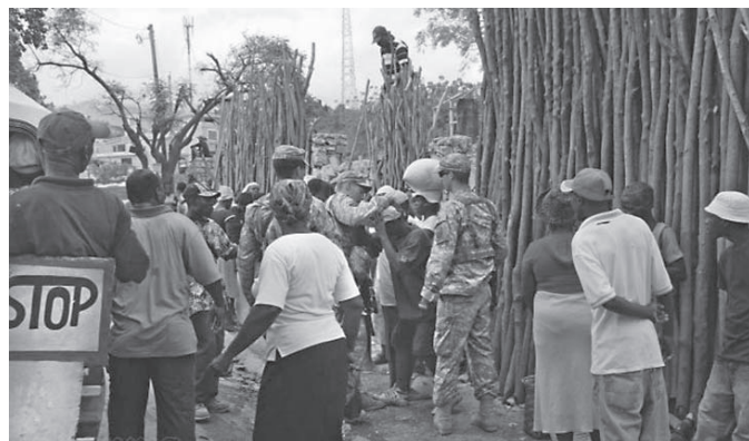
US-Soldaten misshandeln und schlagen einen Haitianer in Port-au-Prince, als dieses Land unter den Auswirkungen eines schweren Erdbebens leidet

Das klingt wie aus dem Drehbuch eines billigen Hollywood-Films, eines Comics mit Helden und Schurken.