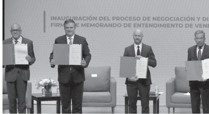
Verhandlungen zwischen der Regierung von Nicolás Maduro und der Opposition in Mexiko.

Die erste Errungenschaft dieses Prozesses besteht in seinem Zustandekommen schlechthin. Den verstocktesten Kern der Oligarchie Venezuelas an den Dialogstisch zu bringen, ist – auch wenn