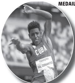
Goldmedaille Robiel Yanquiel Sol Cervantes Parathletik Weitsprung (T46) Weite: 7,46 m