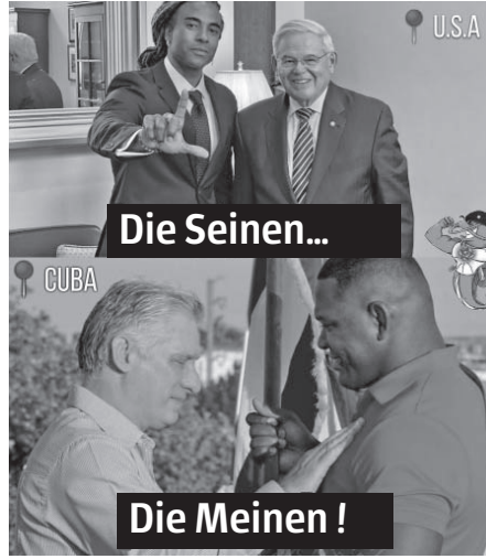
Yotuel ganz offensichtlich in Diensten von denjenigen, die den Hass gegen das Volk Kubas anheizen. Die Unseren werden immer die sein, die lieben und aufbauen MEME DER FB SEITE VON LA CIBERCLARIA

Ein Artikel, der ursprünglich in der New York Times veröffentlicht wurde, beschreibt, wie das Kommunikationsteam der Kampagne der Demokraten