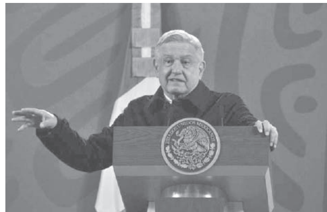
Präsident López Obrador sprach bei seinem Bericht zur Lage der Nation über Eckpfeiler der Entwicklung Mexikos

Bezüglich des Umgangs mit der COVID-19-Pandemie sagte López Obrador, dass ein nationales Impfprogramm entwickelt worden sei, das effektiv funktio-