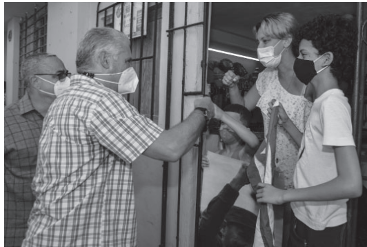
Der Präsident unterwegs durch die Straßen von San Isidro

Heute hätten die Gemeinden eine Entwicklungsstrategie, die direkt die Quelle angeht, die die Probleme verursacht, um sie rechtzeitig zu lösen. Aus diesem Grund bestand er darauf, weiterhin an der Qualität der lokalen