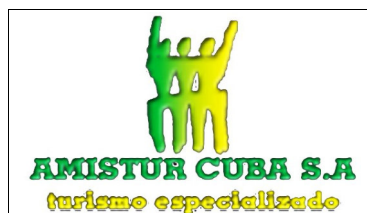
Reisebüro Amistur Cuba S.A.

Das grundlegende Ziel dieses Programms von Aktivitäten besteht darin, mit den Freunden einen weiteren Jahrestag des Sieges der kubanischen Revolution zu teilen und ihnen ein breites Wissen über die Realität, in der unser Volk heute lebt, und über die erreichten gesellschaftlichen Errungenschaften zu vermitteln. Das Veranstaltungsprogramm soll als Brücke der Freundschaft für all diejenigen dienen, die an einer objektiveren Sichtweise Kubas interessiert sind, im Gegensatz zu den Medienkampagnen der Mainstream-Medien, die darauf abzielen, die erreichten Erfolge abzuwerten.