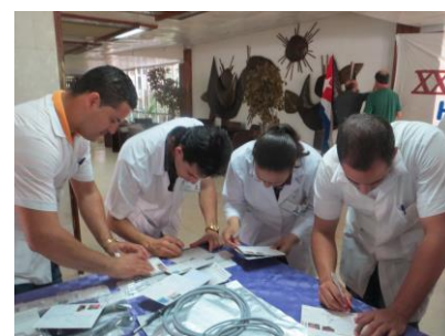
beim Dankeskarten unterschreiben