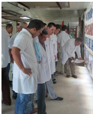
beim Lesen der mitgebrachten Plakate

20 Jahre Endoskopie-Projekt mit dem Hospital Abel Santamaría, Pinar del Río /Kuba und der Freundschaftsgesellschaft BRD-Kuba, Regionalgruppe Stuttgart