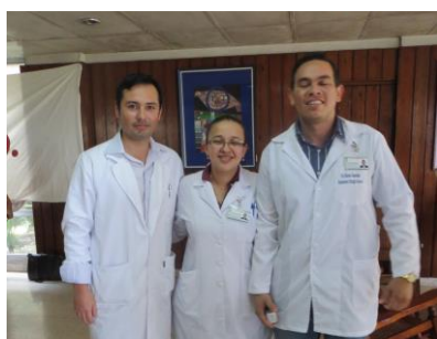
3 Studenten aus Kolumbien, Mexiko und Venezuela